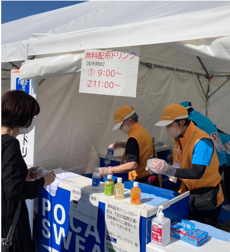
【無料ドリンクコーナー（真岡市）】