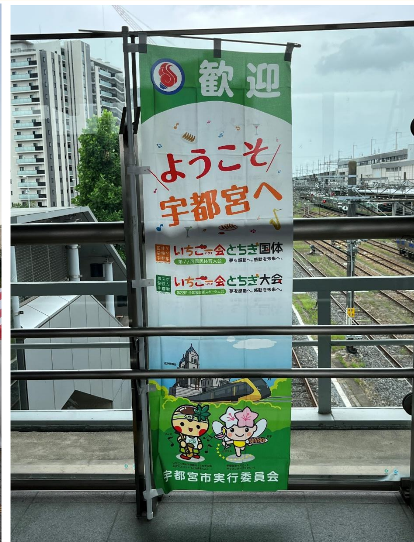
【のぼり旗 (JR宇都宮駅)】