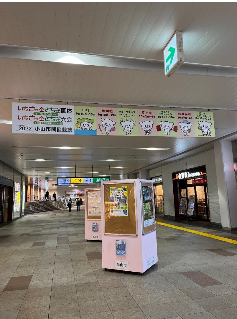
【吊り看板広告 (JR小山駅)】