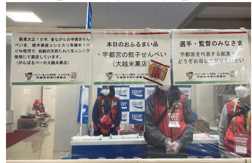
【ふるまい品配布（宇都宮市）】