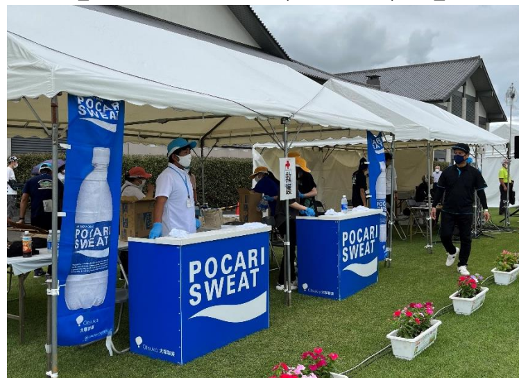
【ドリンク配布（那珂川町）】