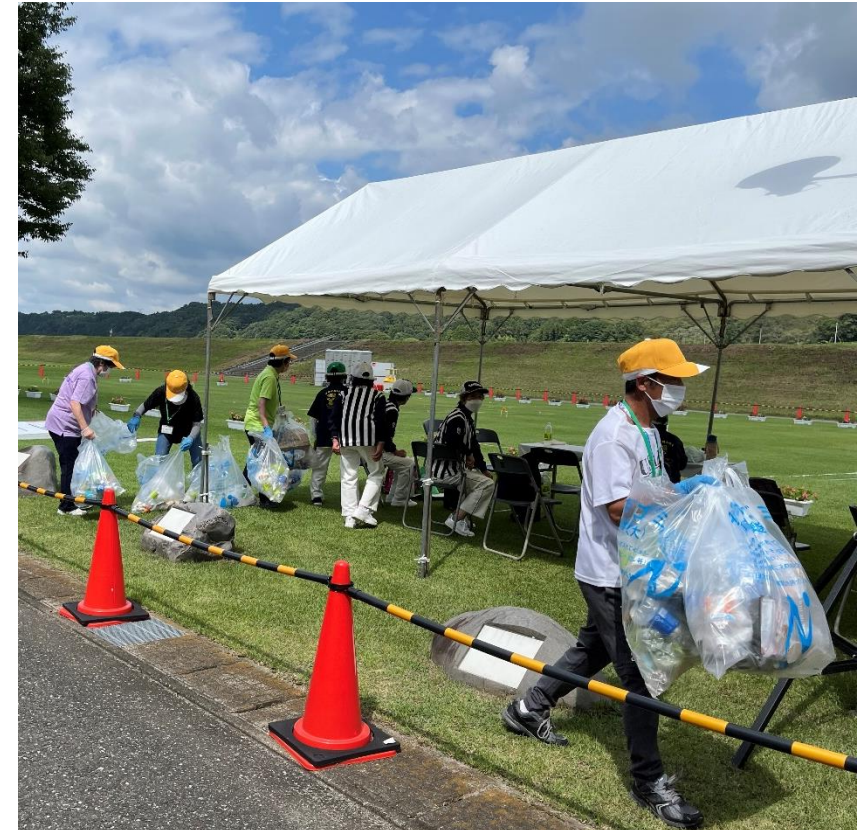
【環境美化（那珂川町）】