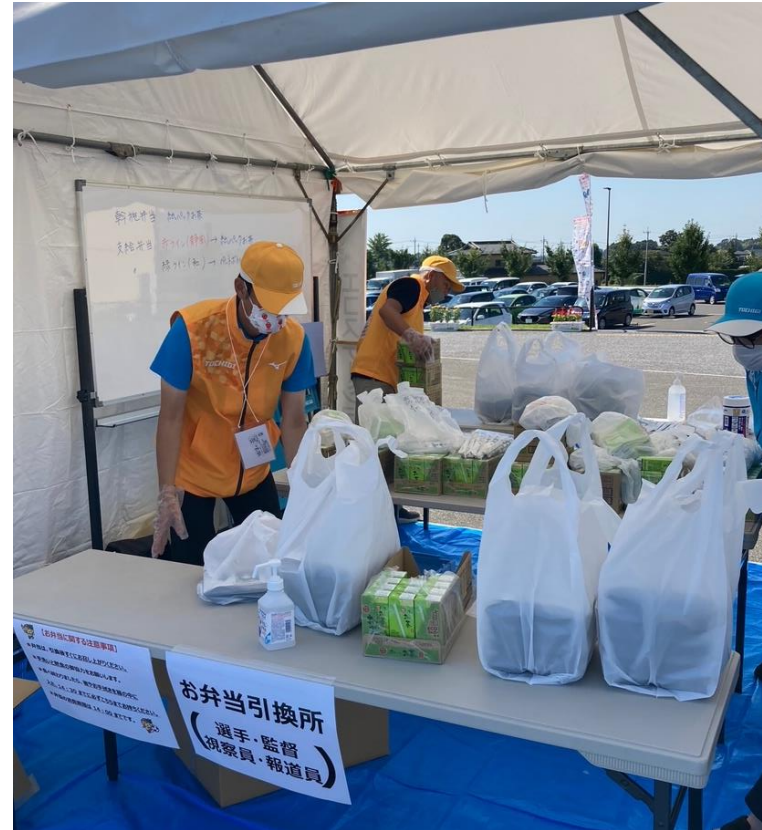
【お弁当引換所（真岡市）】