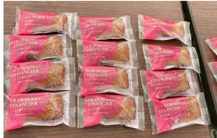
【ふるまい品（真岡市）】