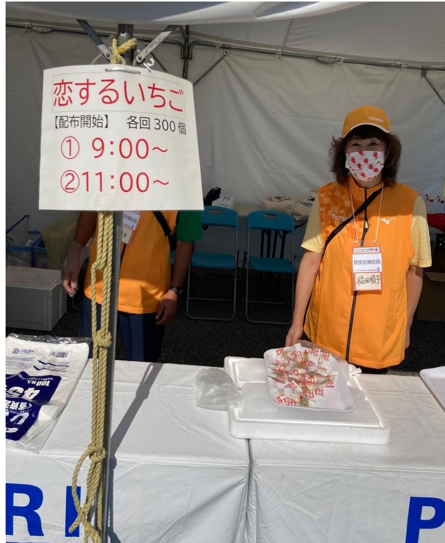
【ふるまい品配布（真岡市）】