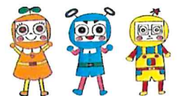
市民活動シエン隊「デキんじゃー」