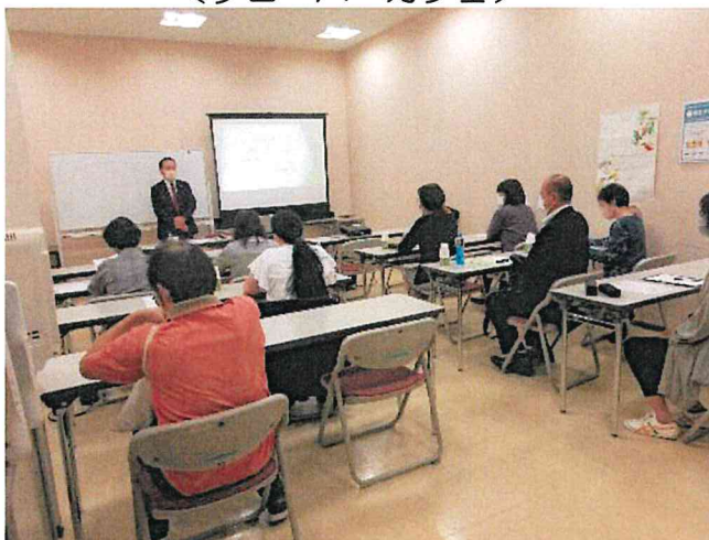
＜クローバーカフェ＞