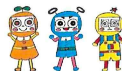
市民活動シエン隊「デキるんじゃー」