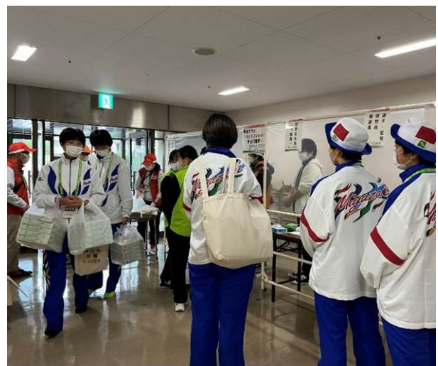
【弁当の配布(宇都宮市)】