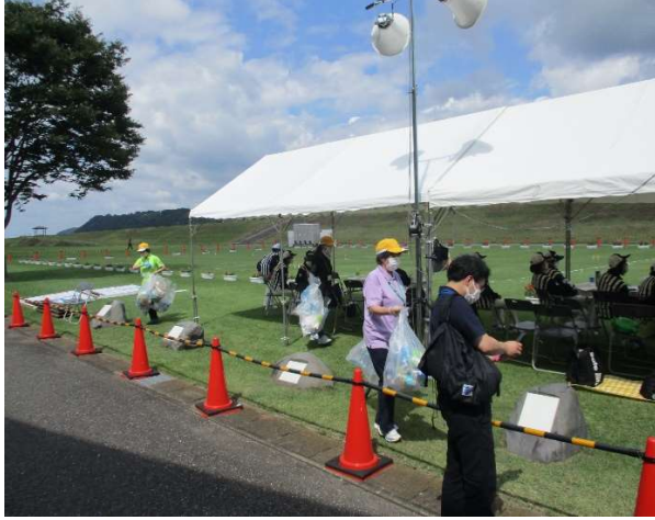
【競技会場内の清掃(那珂川町)】