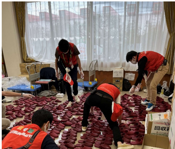
【スリッパの消毒(宇都宮市)】