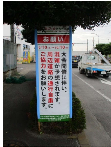
会場周辺告知看板