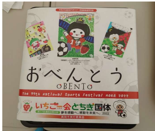
【弁当箱蓋のデザイン(真岡市)】