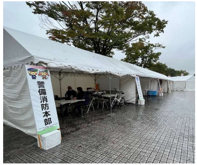
【警備消防本部(佐野市)】