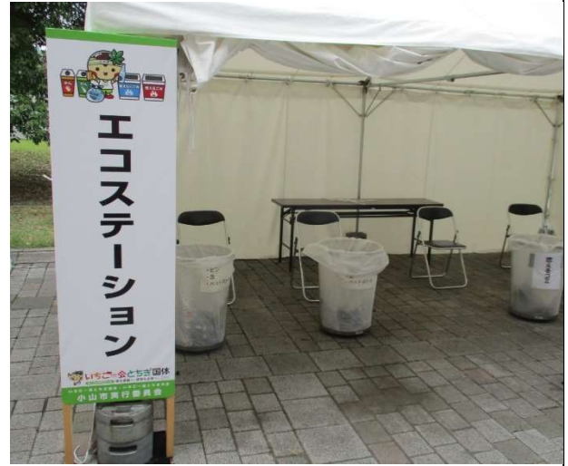
【ゴミの分別(小山市)】