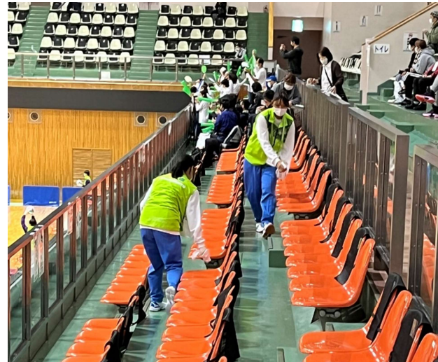
【競技会場内の消毒(宇都宮市)】