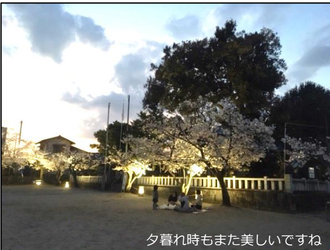
夕暮れ時もまた美しいですね