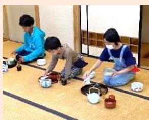
煎茶・抹茶教室 5月13日(土)

令和5年度の年間教室が5月から始まりました。三線教室、夏休み教室、おやつ作り教室、化石発見教室は開催の約1ヶ月前に小学校を通して募集チラシを配布します。