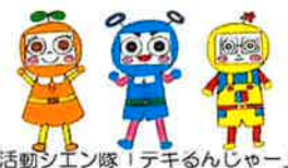
市民活動シエン隊「できるんじゃー」