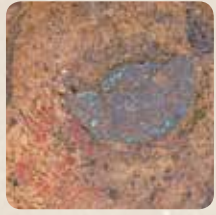
▲朱の痕跡と青銅鏡の出土状況

この墓は人がすっぽり横たわれるくらいの穴を掘り、石のふたを並べたもの（石蓋土壙墓）で、規模は長さ9m、幅50cm、深さ約30cmです。蓋石は二枚だけ残っていました。蓋石は五枚以上だったとみられます。墓の周辺はその後の時代に大きく改変されており、当時の地面は墓が検出された