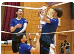
子どもとの交流を楽しむスプリングスの選手