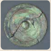
▲割って埋葬されていた中国製の青銅鏡

「鳥栖市誌」発売中 「鳥栖市誌」は、市教育委員会生涯学習課、油屋本店、古賀書店、市役所内売店などで取り扱っています。詳しくは、同課（☎0942-85-3695）へ。