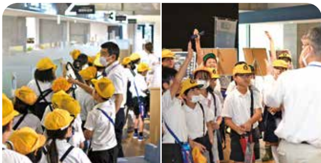
市役所を見て回る児童たち