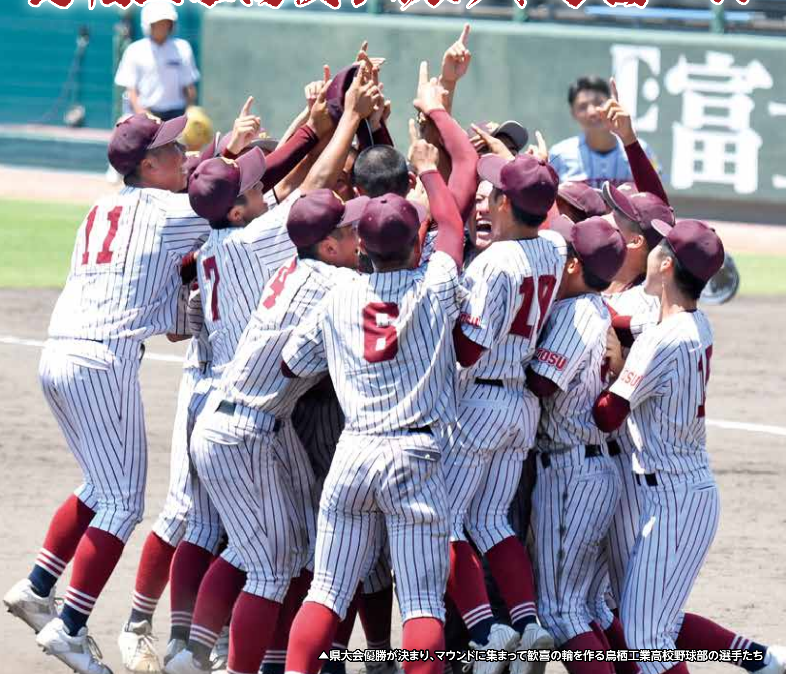
▲県大会優勝が決まり、マウンドに集まって歓喜の輪を作る鳥栖工業高校野球部の選手たち

第105回全国高校野球選手権記念佐賀大会の決勝戦が7月25日(火)、さがみどりの森球場(佐賀市)で開催され、鳥栖工業高校が7対0で勝利。ノーシードから勝ち上がった鳥栖工業高校が見事、春夏通じて初の甲子園出場を決めました。全国大会は、8月6日(日)から阪神甲子園球場(兵庫県)で開催。これからの活躍にもぜひご注目ください。