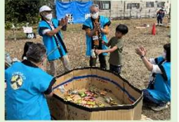
楽しかった昨年の様子です!!