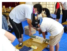
地域の「ものづくり名人」がサポート