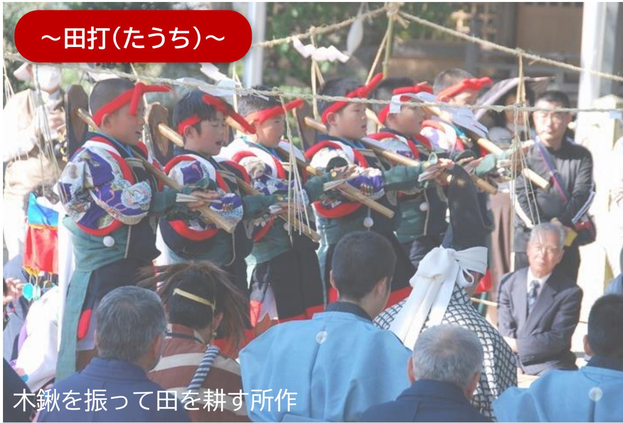
木鍬を振って田を耕す所作