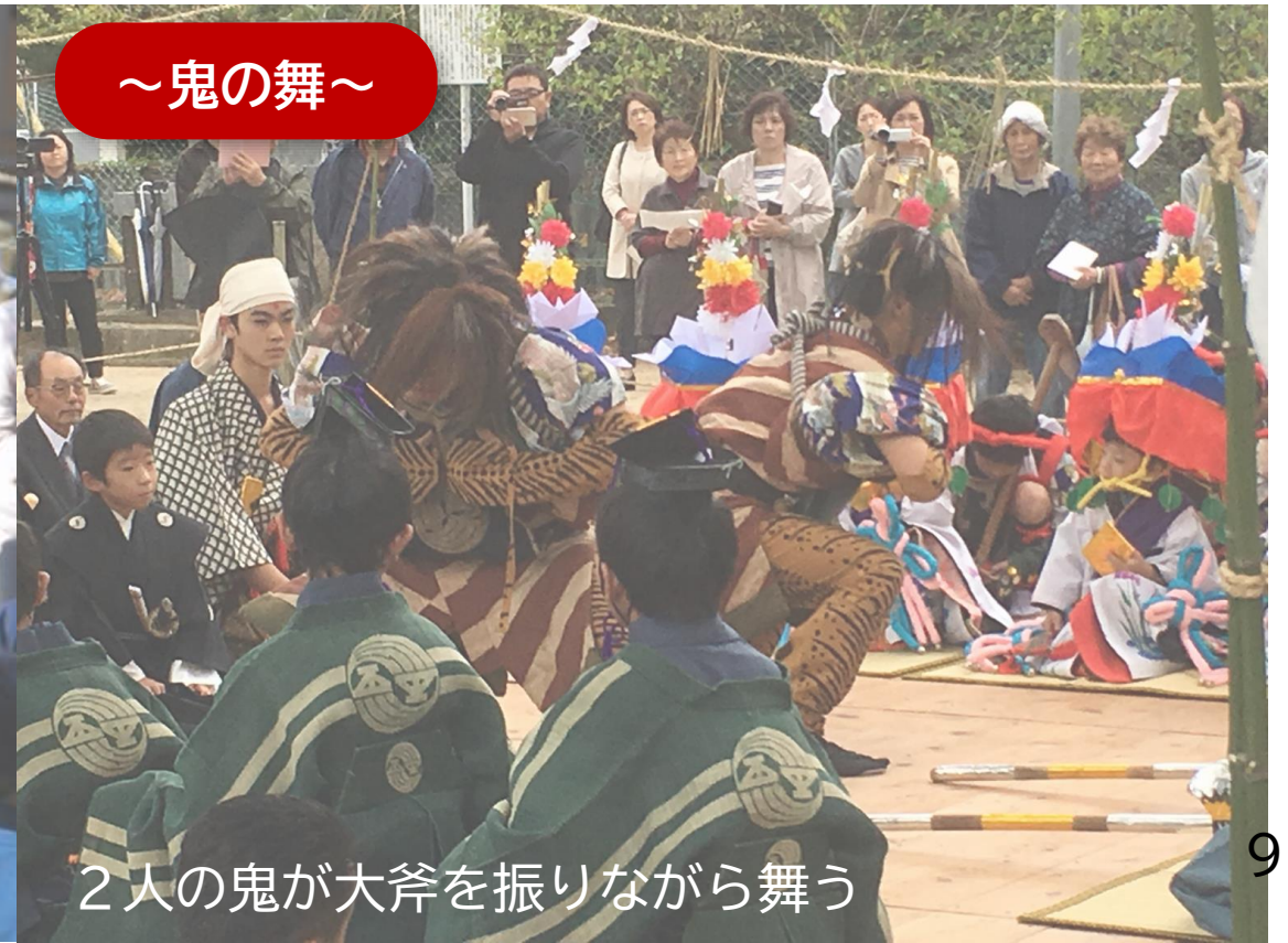
2人の鬼が大斧を振りながら舞う