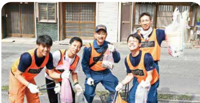
集めたごみを手に笑顔の選手たち

鳥栖プレミアム・アウトレット、ブリヂストン鳥栖工場、ヤマト運輸佐賀主管支店、市環境保全協会と市の5者共催で、サロンパス アリーナ の開業を記念して一般社団法人ソーシャルスポーツイニシアチブと協力し、スポGOMI in 鳥栖を開催しました。スポGOMIは、競技エリア内で拾ったごみの種類や量を競うスポーツで、当日は3~5人組の32チーム143人が出場。60分の競技時間で約185kgのごみが回収されました。