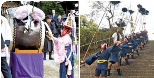
村田八幡神社から『おくだり』の行列を開始

市の重要無形民俗文化財に指定されている『村田浮立』が、村田八幡神社と江島町石王社一帯で行われました。村田浮立は豊年感謝・無病息災の芸能として江戸時代から続き、村田町の獅子舞では約200年の歴史で初めて女性が参加。4人の女子児童が太鼓たたきと笛を務めました。2頭の獅子舞浮立と大名行列の様式を残す行列浮立が特徴で、鉦や太鼓の音色に合わせて威勢のいい掛け声が響き渡りました。