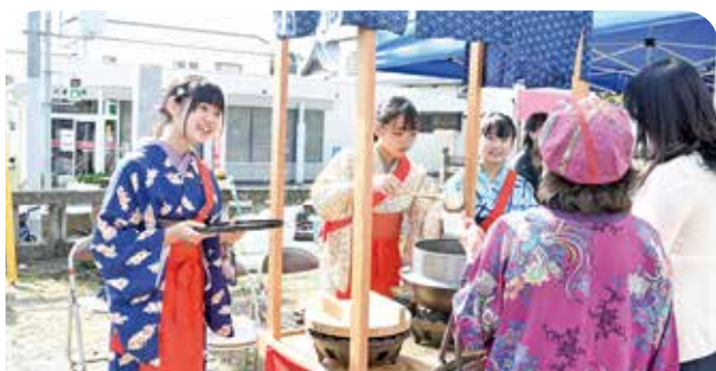
学生ボランティアが茶屋娘 ちやんやぬら に扮し、まつりを盛り上げました