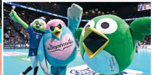
(左から)ハルちゃん、ウイントス、とつとちゃんも会場で応援

2023-24 V.LEAGUE DIVISION1 WOMEN(V1女子)が10月21日(土)に開幕。チームの活動拠点が鳥栖市に戻ってきて最初のシーズンに臨んだ久光スプリングスは、ホームの大歓声を受けて、見事開幕2連勝を飾りました。