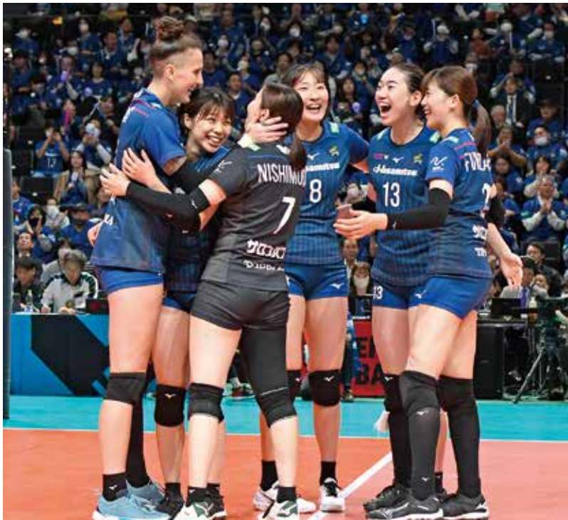
歓喜の輪を作る久光スプリングスの選手たち