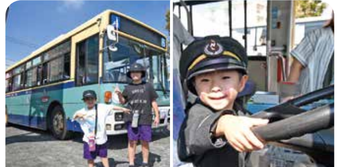
イベントに訪れバスに触れ合う子どもたち

JR鳥栖駅前のバス停南交流広場と鳥栖駅西広場で『バスの日』イベント in 鳥栖を開催。ドライブシミュレーターやちびっこ運転士体験、夜行高速バスはかた号の試乗会などバスに触れ合う催しが実施された他、久光スプリングスのブースなども設けられました。『バスの日』は、明治36年9月20日に日本で初めてバスが走ったことを記念して制定されたもので、バスに親しんでもらおうと、イベント当日は路線バス市内線とミニバスを無料で運行しました。