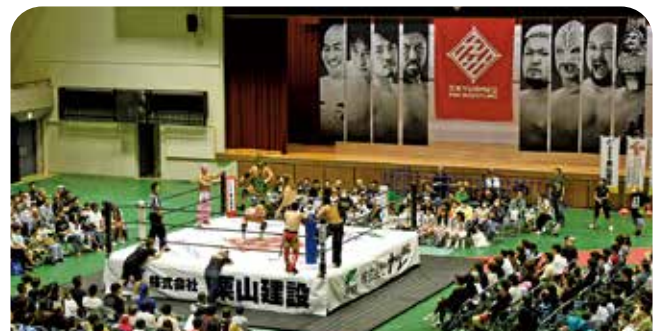
プロレスラーによる大迫力の戦い

市民体育館で『株式会社栗山建設PRESENTS 鳥栖ば元気にするケン!』が開催されました。九州プロレスは、2008年7月に福岡県からNPO団体の認証を受け、以来『九州ば元気にするパイ!』を理念に掲げて活動。試合の他、青少年健全育成や施設慰問などを行っています。当日は小学生以下を対象としたちびっこプロレス教室とプロレス4試合が行われ、屈強なプロレスラーによる大迫力の戦いに、会場は大いに盛り上がりしました。