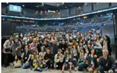
応援ツアーの参加者たち