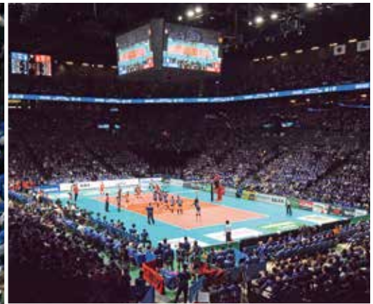
1階から4階まで観客で埋まった会場の様子