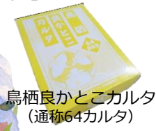
鳥栖良かところカルタ (通称64カルタ)