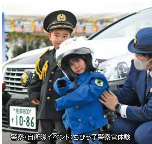
警察・自衛隊イベント:ちびっ子警察官体験