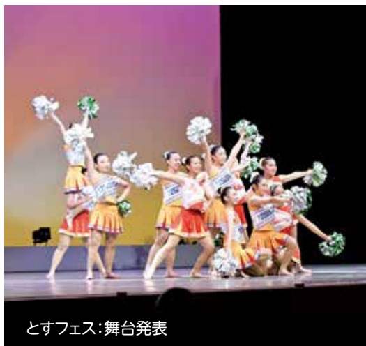
とすフェス:舞台発表