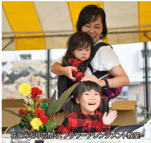
花とみどりの祭り:フラワーアレンジメント教室