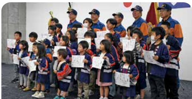
キッズ消防団員に委嘱されたこどもたち

市キッズ消防団員委嘱式を市役所で開催し、3歳から中学校1年生までのこどもたち31人へ、委嘱状の交付を行いました。式では一人一人名前を呼ばれると元気よく返事し、真剣な顔つきで敬礼も披露。「火には気を付けるように呼びかけたい」「安全なまちにしたい」と意気込みを話しました。今回委嘱されたキッズ消防団員は、11月の秋季火災予防運動で、消防団員である家族と一緒に管轄地区内を巡回し、火災予防を呼びかけました。