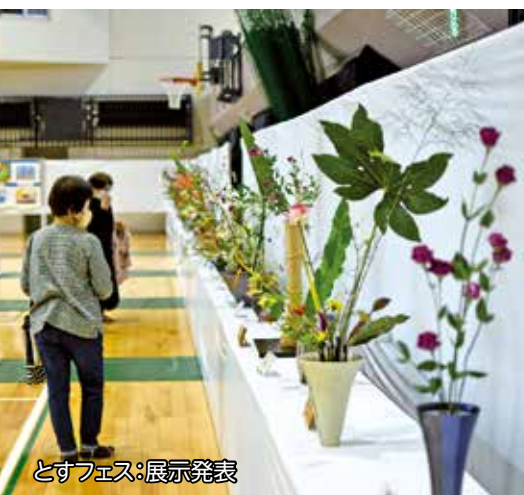
とすフェス:展示発表