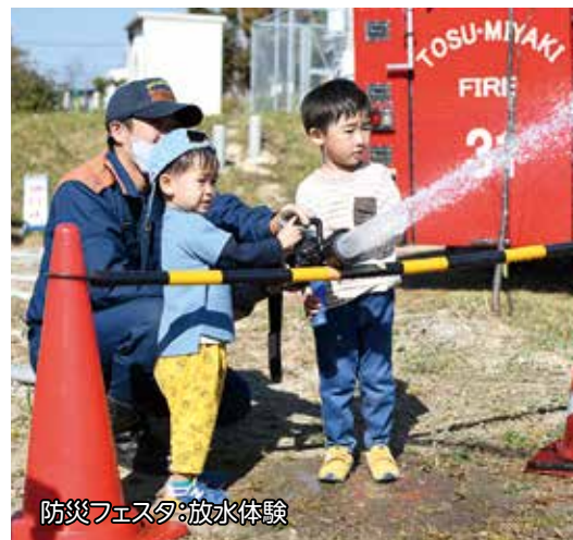
防災フェスタ:放水体験