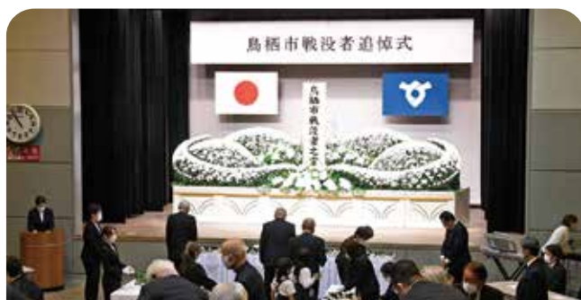
参列者による献花が行われました

先の戦争で亡くなった方々に対して追悼の意を表し、恒久平和を祈念するため、市遺族連合会と市の共催で戦没者追悼式を開催しました。同様の式典はこれまで各地区で行っていましたが、本年度からは市全域を対象にサンメッセ鳥栖で開催。式には、遺族会や関係者など約140人が参列し、戦没者の冥福を祈り、黙とうをささげました。その後、主催者からのあいさつと来賓の皆さんから追悼のことばをいただき、参列者全員による献花が行われました。