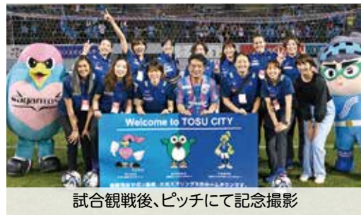
試合観戦後、ピッチにて記念撮影

— チームを身近に感じてもらえるようにこれから頑張りたいことや、サロンパス®アリーナの特徴など、最後に市民の皆さんへ一言お願いします。