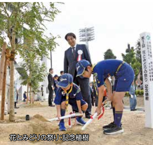
花とみどりの祭り:記念植樹