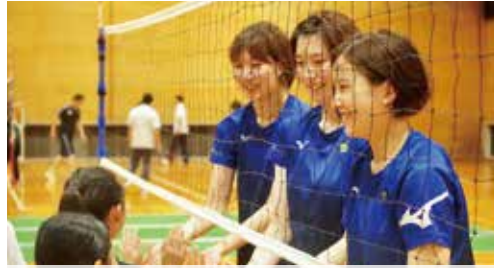
地区スポーツ教室で市民と触れ合う選手たち

鳥栖の皆さんはとても優しく、スポーツ教室などでもたくさんお話ししてくださり、楽しい時間を過ごすことができました。私たちがより身近に感じてもらう、共に戦うチームになればと思います。