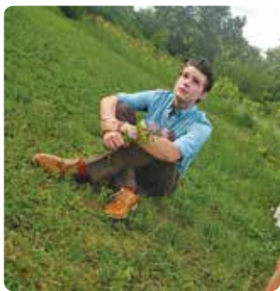
▶アイオワ州での近影

栖市にやって来ました。来年の7月まで日本の高校で学びます。鳥栖はとても素晴らしいまちです。みんなとても親切だし、食べ物もとても素晴らしいです。すでに人生最高の味のラーメン店を2つほど見つけました。博多まで電車で行って、福岡を探索するのも大好きです。 将来は作家と教師になりたいです。趣味で作曲をするので、もしそれが軌道に乗ったら作曲家もいなどと考えています。私の記事を読んでいただき、ありがとうございます。