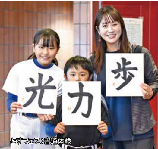
とすフェス:書道体験