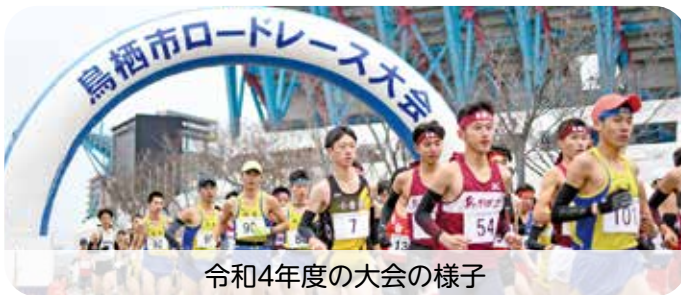
令和4年度の大会の様子

市ロードレース大会を開催します。大会開催に伴い、コース周辺道路の交通規制を行います。規制時間中は、鳥栖警察署、交通安全指導員、同大会実行委員が車の誘導にあたりまますのでご協力をお願いします。なお、大会への参加申し込みは終了しています。