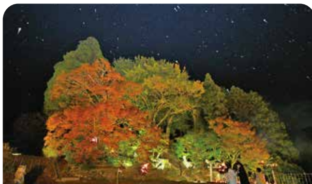
ストロボの光に雨粒が反射し、星空のように映し出されました

河内やまびこ会の活動で、大山祇神社周辺の紅葉のライトアップが行われました。11日はステージイベントも実施され、家族連れや友人同士など多くの方が来場。雨が降る時間帯もありましたが、水たまりに反射した風景を写真に収めるなど、晴天時とは違った幻想的な風景を楽しんでいました。同神社は「22世紀に残す佐賀県遺産」に認定されており、例年11月中旬に紅葉が見頃を迎えます。