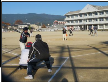
ソフトボール大会