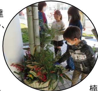
熊笹の植え込みも お手伝いしてもらいました