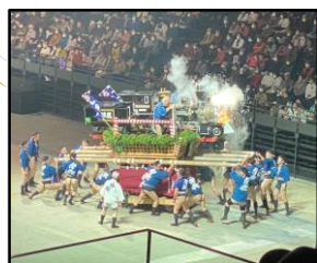
火花や煙を出す 中央区の「弁慶号」