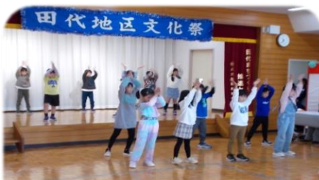
田代大官町 ゆりの会