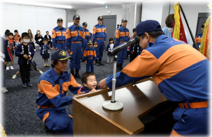
11月2日 キッズ消防団員委嘱式