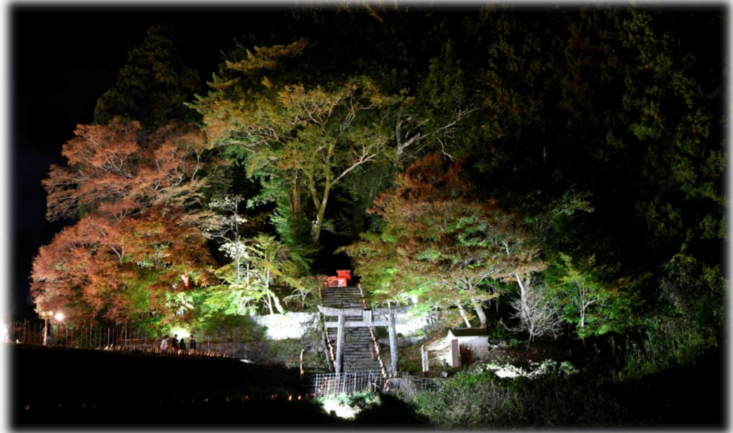
11月11.12日 大山祇神社ライトアップ