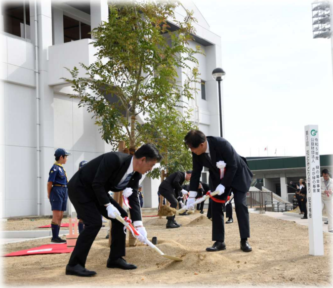
11月4日 花とみどりの祭り