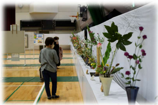
11月3、4日 市政功労者表彰 市民文化祭 とすフェス