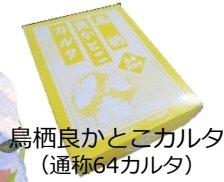
鳥栖良かところカルタ（通称64カルタ）

鳥栖良かところカルタは、今を知り、昔を学ぶ地域学習の身近な教材として、家族や地域での世代間ふれあい活動の一助として作られたものです。