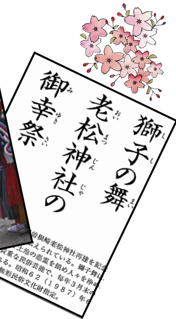
曾根崎老松神社再建を記 す。獅子舞は、土地の悪 霊を鎮め人々を浄め、 豊作を祈願する貴重な 民俗芸能で、毎年3月 末の日曜日に奉納され る。昭和62(1987)年 6月13日、市重要無形 民俗文化財指定。