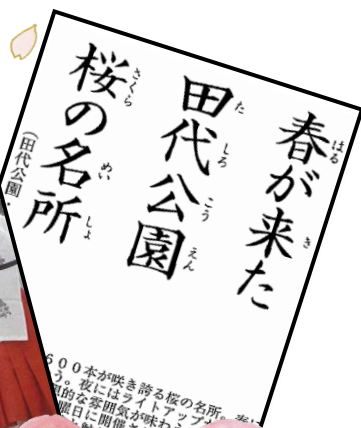
ソメイヨシノ600本が咲き誇る桜の名所。春には花見客で賑わう。夜にはライトアップが楽しみ、昼間とは違う幻想的な雰囲気味わえる。それから、3月の最終日曜日に開催される「とす弥生まつり」は歴史・自然と触れ合える祭り。