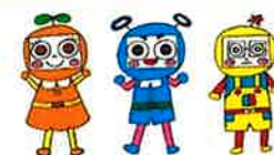
市民活動シエン隊「できるんじゃー」