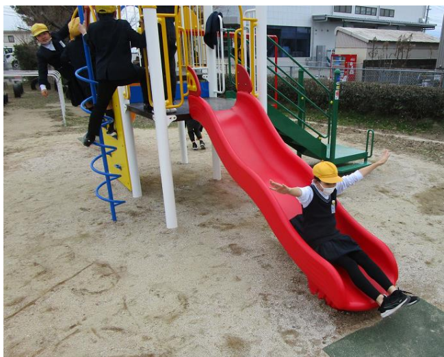
基里小学校のインクルーシブ遊具で遊ぶ子ども達