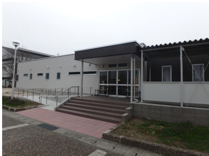
鳥栖北小学校なかよし会B・Cクラス