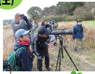
「バードウォッチング」