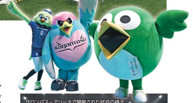
サロンパス®アリーナで開催された試合の様子