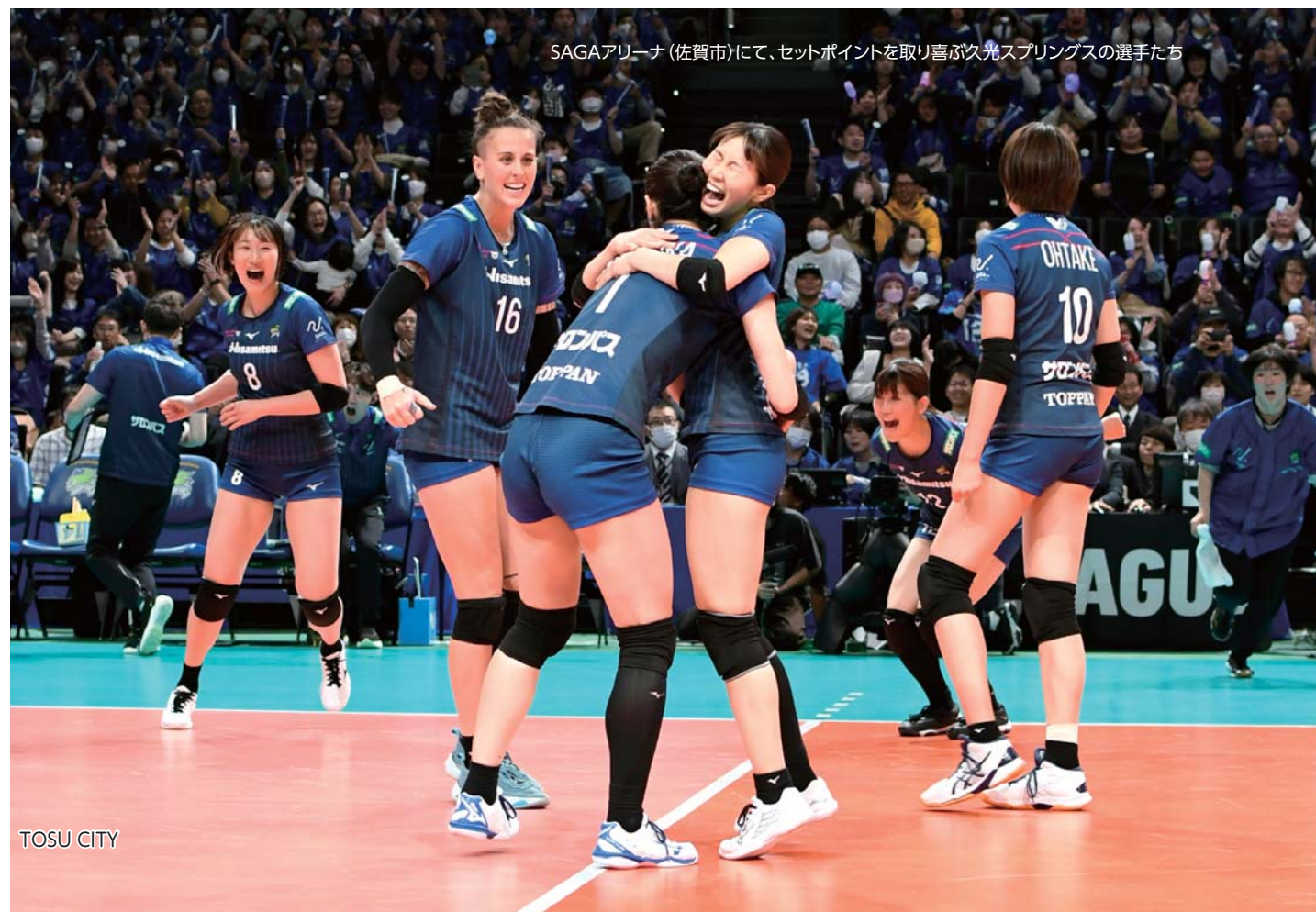
SAGAアリーナ(佐賀市)にて、セットポイントを取り喜ぶ久光スプリングスの選手たち