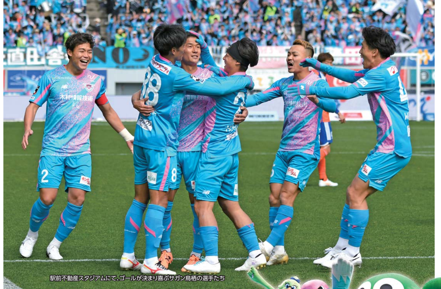
駅前不動産スタジアムにて、ゴールが決まり喜ぶサガン鳥栖の選手たち