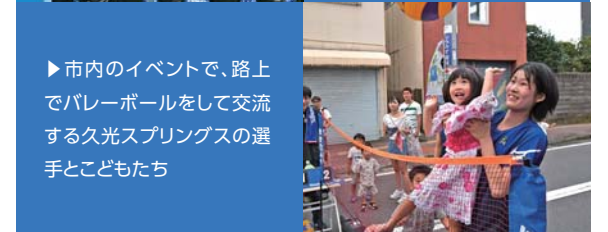
市内のイベントで、路上でバレーボールをして交流する久光スプリングスの選手と子どもたち