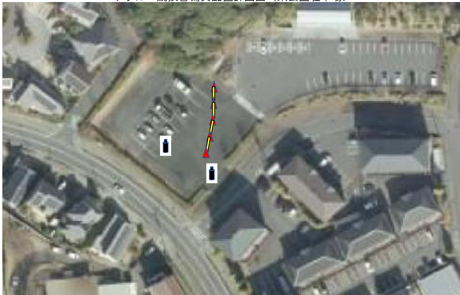
サッカー競技警備員配置計画図（東公園駐車場）