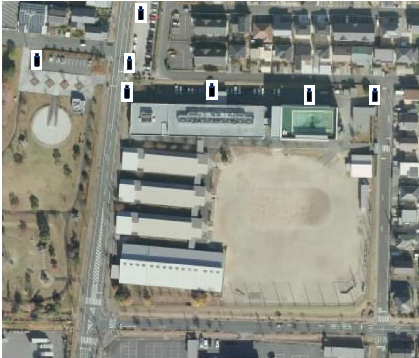
サッカー競技警備員配置計画図（弥生が丘小学校付近）