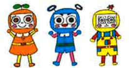
市民活動シエン隊「できるんじゃー」