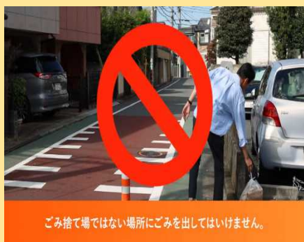
ごみ捨て場ではない場所にゴミを出してはいけません。