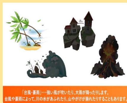
「台風・豪雨」…強い風が吹いたり、大雨が降ったりします。台風や豪雨によって、川の水があふれたり、山やがけが崩れたりすることもあります。