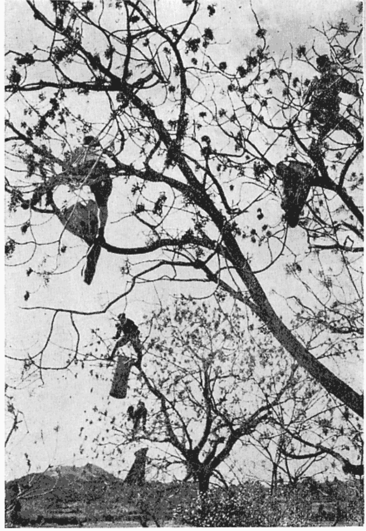
写真上 写真左 ハゼの実採り 鳥栖市山麓部では毎年十一月〜十二月にかけて榎ちぎりの姿がみられた(昭和三十年、山浦町で)