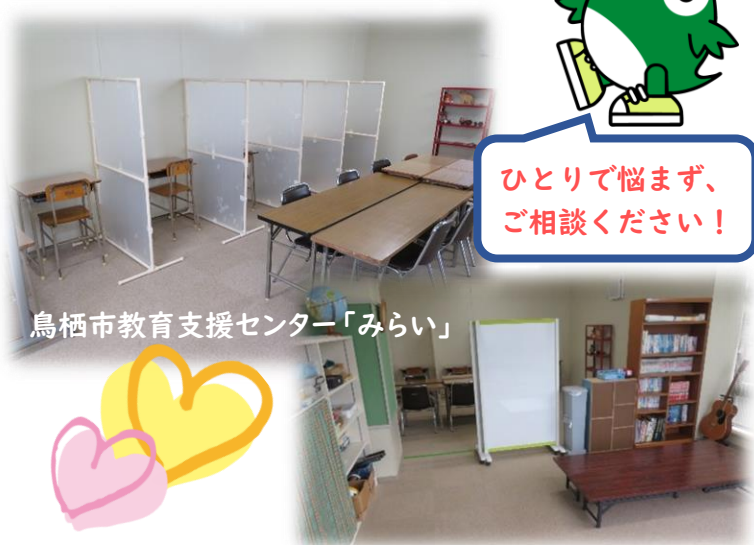
鳥栖市教育支援センター「みらい」