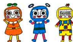
市民活動シエン隊「デキるんじゅー」