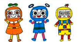
市民活動シエン隊「デキるんじゃー」

年末年始休館日：12月29日(日)～1月3日(金) 年始は1月4日(土)より開館します。