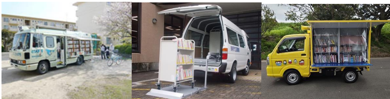
初代移動図書館車