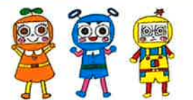
市民活動シエン隊「できるんじゃー」