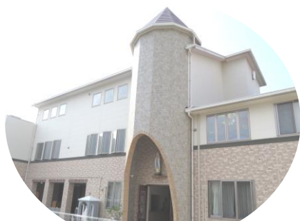
認定こども園 鳥栖カトリック幼稚園