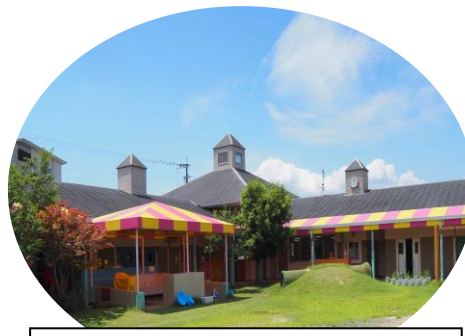
認定こども園 あさひ幼稚園 令和8年度より認定こども園に移行