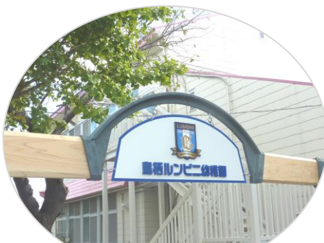
鳥栖ルンビニ幼稚園