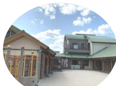
認定こども園 めぐみ保育園