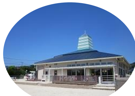
認定こども園 神辺幼稚園