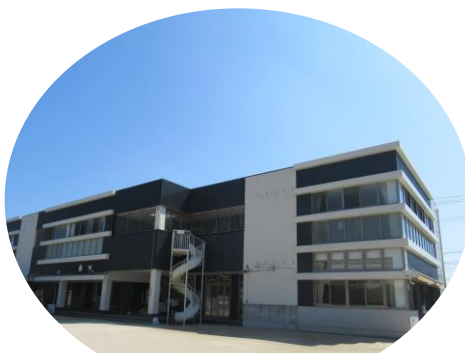
認定こども園 布津原幼稚園