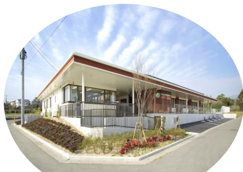
弥生が丘マイトリー幼稚園