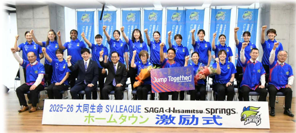
10月3日 SAGA久光スプリングスホームタウン激励式