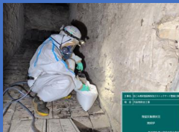
プラント機器内 残留灰集積