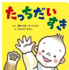
文 聞かせ屋。けいたろう 絵 ひろかわさえこ アリス館 2018 年