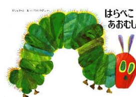
作 エリック・カール 訳 もりひさし 偕成社 1976 年