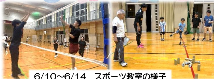
6/10～6/14 スポーツ教室の様子

弥生が丘地区全体に活気と笑顔が飛び交うまちになるよう、皆様方のご理解とご協力をよろしくお願いいたします！