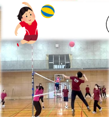
ソフトバレーボール大会の様子