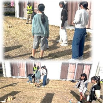
11/23 やよいの日・文化祭の様子