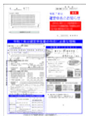
▲確定申告のお知らせ(イメージ)