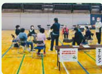
▲全体交流会の様子