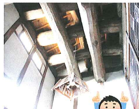
土間から見上げた天井。見事な梁にしばし絶句!!

右の写真は、2軒目に訪問した紅屋呉服店の2階から1階を見下ろす扉です。お店の2階から大きな荷物を降ろす時に使っていたそうです。明治元年に創業し、田代地区に店をかまえられて150余年。お店の歴史と共に、毎年12月に行われている田代のあびす市のことなど田代の変遷についても伺うことができました。