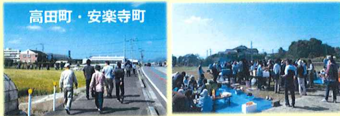
高田町・安楽寺町

〈ウォーキング〉・高田町・安楽寺町の合同で約3Kmを歩いて、バーベキューを楽しみました。