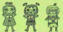
市民活動シエン隊「できるんじゃー」