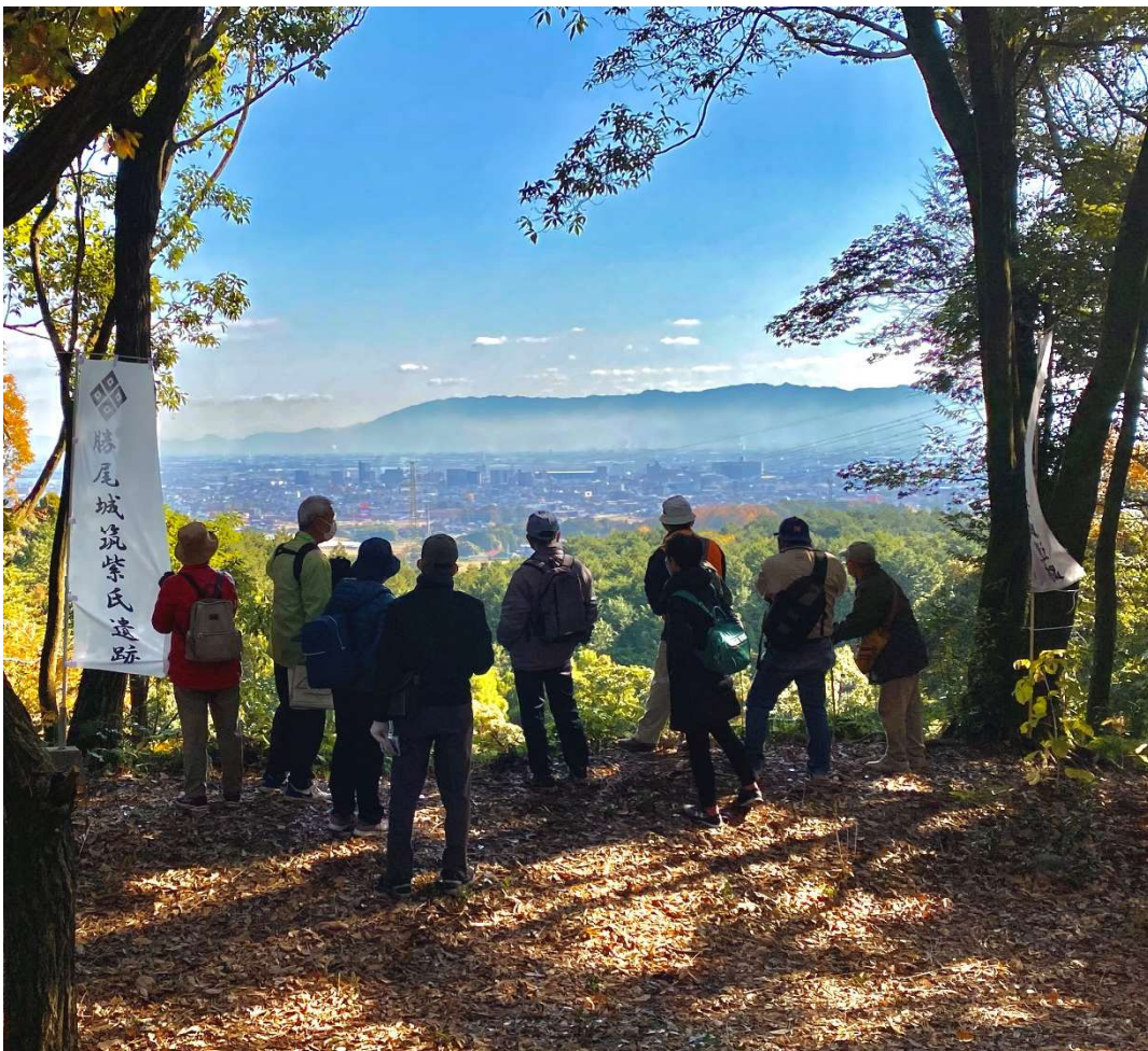
葛籠城の主郭から市街地を眺める参加者のみなさん