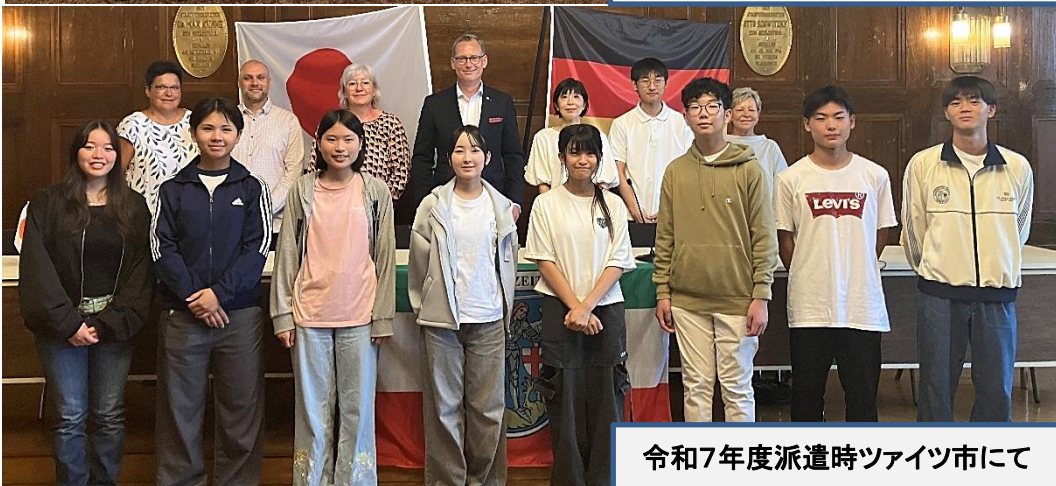
令和7年度派遣時ツァイツ市にて

鳥栖市は、平成12年(2000年)にフッペルのピアノの故郷であるドイツ連邦共和国ザクセン-アンハルト州ツァイツ市と、平和と音楽を基調とした交流をスタートさせました。以来、互いに訪問しあうなど心と心の交流を深め、平成24年(2012年)に友好交流都市協定を締結しました。