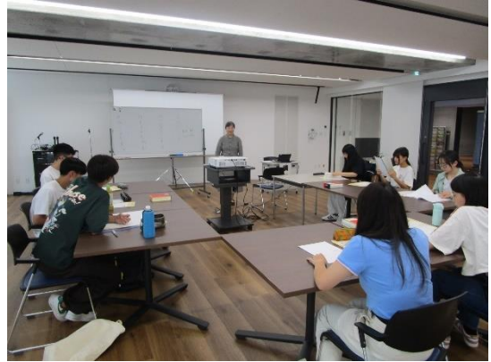
派遣学生向け事前研修 (ドイツ語)