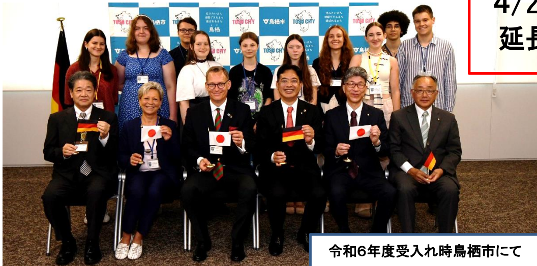
令和6年度受入れ時鳥栖市にて