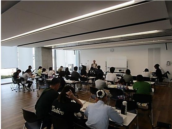
ホストファミリー向け事前研修 (ドイツ語)