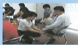
(美姿勢ストレッチ講座)

本年度(令和元年度)のセンター主催講座は、3月12日(木)のリンパドレナージュ講座をもって終了します。今年度も美姿勢ストレッチ講座、坐禅体験講座、冬のおもてなし料理教室等様々な講座にご参加いただきありがとうございました。