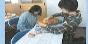
(エコクラフト雑貨作り教室)