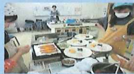
(冬のおもてなし料理教室)