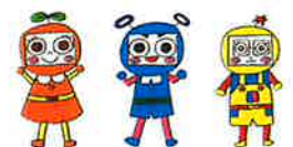
市民活動シエン隊「デキるんじゃー」