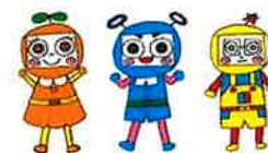
市民活動シエン隊「デキるんじゃー」

※休館日 毎週水曜日・祝日・年末年始(12/29~1/3) とす市民活動センターはいつでも皆さんをお待ちしております。