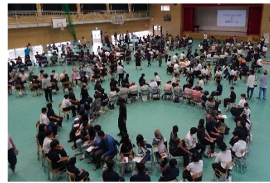
「大人としゃべり場」の様子