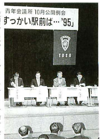
意見が相次ぎ出された

鳥栖駅周辺のまちづくりを考える討論会「どげんすつとかい駅前ば...95」が十月十一日、サンメッセ鳥栖で開かれました。パネリストには都市設計の専門家や山口県下松市のまちづくり推進協議会会長、市の担当課長ら五人が招かれ、それぞれの立場でこれまでの取り組みを説明し、意見を交換。「商業者は自分の商売だけでなく、片手にそろばん、片手に夢とロマンを持つことが大切」「イベントなどすぐにできることから進め、ムードを盛り上げることも必要」などの意見が相次ぎ出され、百人を超える聴衆の中には一生懸命メモをとる姿も見られました。