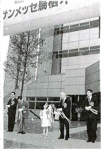
市長ら5人がオープンのテープカット

るテープカットが正面玄関前で行われたあと、集まった市民ら約百人が入り口で記念品を受け取って次々と入館。施