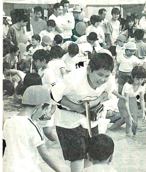
取った獲物は逃がさないぞ(魚のつかみどり)