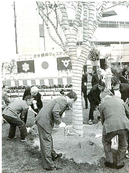
サンメッセ前広場にケヤキを記念植樹

さがつるおいのある緑豊かなまちづくりを目指した「佐賀県都市緑化祭」が十月七日、サンメッセ鳥栖前広場で開かれ、色とりどりの花々や緑の木々で飾られた会場に大勢の市民が訪れました。