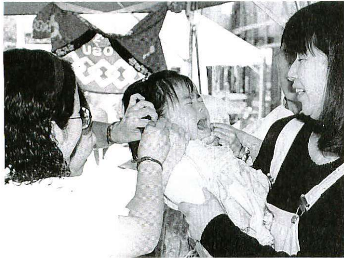
血液型は何か？ すぐ終わるからね (血液型判定コーナー)

さわやかな秋晴れとなった十月十五日(日)、「めざせ！健康広げよう／ふれあいの心」をスローガンに「第11回市民健康福祉まつり」が市民公園一帯で開かれ、家族連れの市民などでにぎわいました。今回は、地域おこしを目指して長崎街道沿線の十五市町が参加した「肥前歴史街道いきいき道中・イベントフェスタ」や生徒が実習などで製作した作品を展示した「佐賀県工業高校生徒作品展示会」も同時開催。工夫を凝らした催しでまつり全体を盛り上げました。