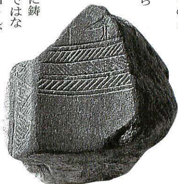
定説を覆す大発見となった銅鐸鑄型片

（約千九百年前）のものと思われる。しかし、長年信じられてきた定説が、わずかに一個の鑄型片の発見だけで簡単に覆ったわけではありませんでした。「近畿地方から九州に鑄型が持ち込まれたのではな