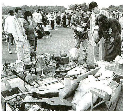
掘り出し物などを求める買い物客でにぎわうガラージセル