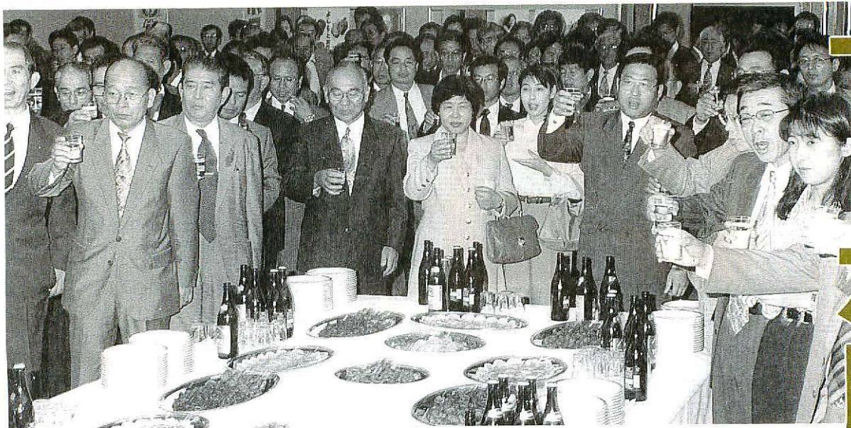
「どんどん飲んで、エビス顔で誘致を実現しよう」と、氣勢を上げるエビス会