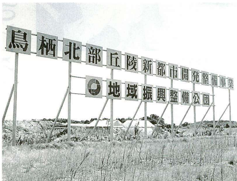
サッポロビールの誘致をめざす北部丘陵新都市

九州工場の移転は、老朽化して生産効率が悪くなったことや、JR門司駅に近く鉄道輸送に適していたが、トラック輸送に切り替わり、立地の優位性がなくなったことなどが理由。九州工場は大正二年建設で、ビール工場としては日本最古。従業員数約二百二十人、敷地面積八万平方メートルで、年間製造能力八万トンの新工場は、生産能力を現在の一・八倍に当たる十五万トンの一・八倍に引き上げるなど規模を拡大、同時にビール園など集客力のある施設を併設して