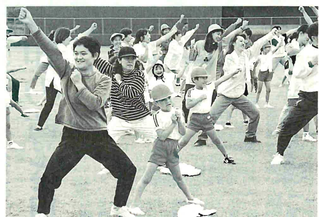
お父さんお母さんと一緒に体力づくり(保育まつり)

功労者表彰のあと、地区ごと に手品や仮装しての踊りを披 露、場内を沸かせました。市 民球場での保育まつりには市 内九保育園から親子約四百人 が参加、ここにこ顔の園児ら は元気に体を動かしていました。