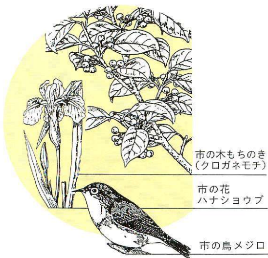
市の木もちのき (クロガネモチ)