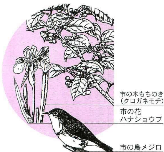
市の木ももちのき (クログアネモチ)